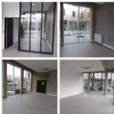
Grande salle – Petite salle